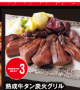
熟成牛タン炭火グリル