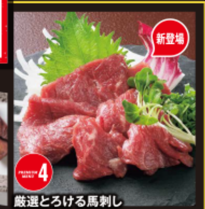
厳選とろける馬刺し