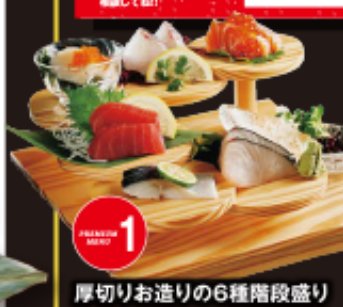
厚切りお造りの6種階段盛り