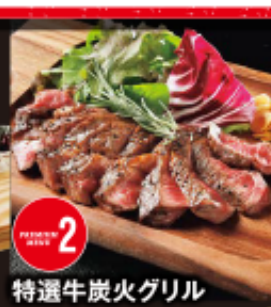
特選牛炭火グリル